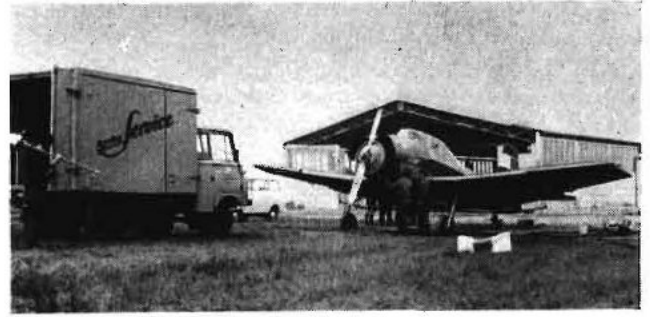
Bild 1. Agrarflugservice im ACZ der BHG Laußig; im Hintergrund die Unterstellhalle für Flugzeuge

Im Verlauf der Jahre hat sich das avio-chemische Arbeitsartenpektrum ständig erweitert. Der gegenwärtige Stand ist Tafel 1 zu entnehmen. Im Bereich der Düngung entwickelt sich die bestandsschonende und bodendruckfreie späte Stickstoffdüngung (Schosserdüngung) und im Pflanzenschutz die Bekämpfung der Kartoffelkrautfäule zu avio-chemischen Primärarbeiten. Leider können die verstärkten Anforderungen der Hauptproduzenten von Getreide und Futterleguminosen nach der Anwendung von Aeroherbiziden bzw. chemischen Defolianten mangels geeigneter chemischer Mittel nicht erfüllt werden. Spezielle Untersuchungen des Nutz-